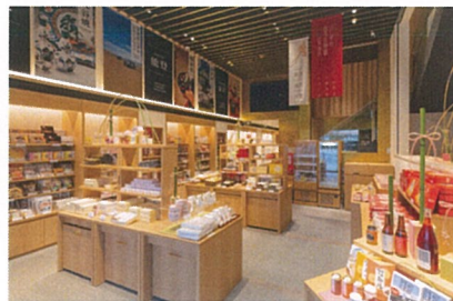
「いしかわ百万石物語 江戸本店」