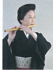
和楽器ユニット「いのあ」